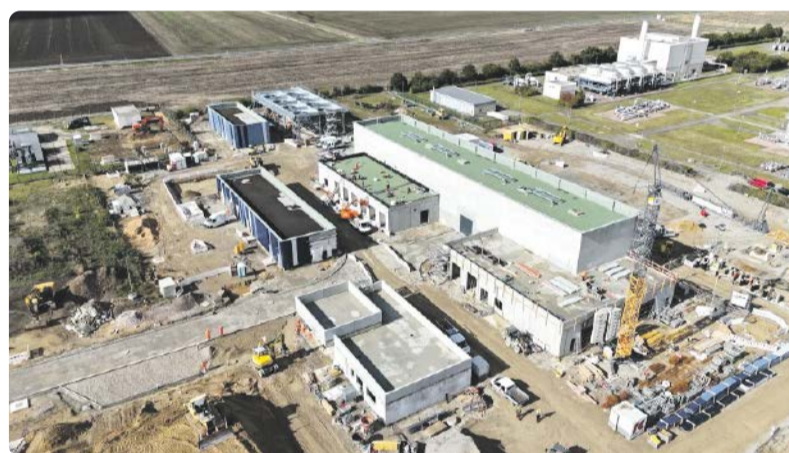
Im Energiepark Bad Lauchstädt werden alle Aspekte der intelligenten und wirtschaftlich optimalen Integration des Energieträgers grüner Wasserstoff abgedeckt.

Dafür wurde vom Projektteam bestehend aus Uniper, weiteren externen Partnern und Mitarbeitern des Unternehmens in einem ersten Schritt die Anlage analysiert, um den Prozessbedarf und die Energieflüsse zu verstehen. Anschließend erstellte das Team einen digitalen