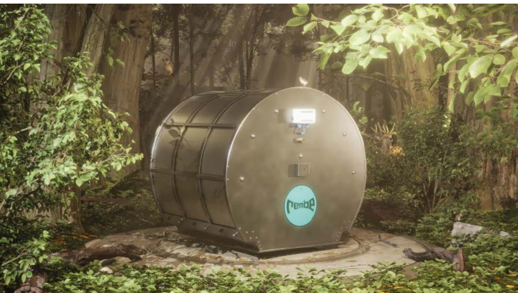
Rembe stellt mit der Q-Box R3leaf seine erste nachhaltige flammenlose Druckentlastung vor.

Das Thema Explosionsschutz ist für Anlagenbetreiber und Maschinenhersteller allgegenwärtig, sobald es um die Bearbeitung oder den Transport von brennbaren und explosionsfähigen Stäuben geht. Im Gegensatz zur gesellschaftlichen Annahme, wonach ein erhöhtes Explosionsrisiko nur bei Gasen besteht, können auch bei brennbaren Stäuben durchaus enorme Kräfte freigesetzt werden.