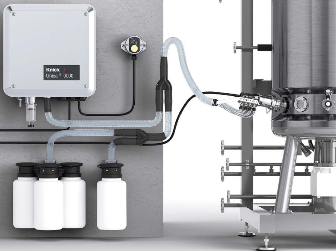
cCare System – cleaning, calibration, conservation: Das vollautomatische pH Sensor Wartungssystem kalibriert nach festgelegten Standards und sorgt für verlässliche Messungen.

„Ist Ihnen bewusst, dass die manuelle Kalibrierung von pH-Sensoren zu den größten Risiken für Chargenverluste zählt?“. Mit dieser Frage hat die erfolgreiche Zusammenarbeit zwischen Knick und einem großen Pharmaunternehmen begonnen, die zur Weiterentwicklung des cCare Systems für die Anforderungen der Biopharmaproduktion geführt hat.