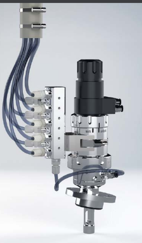
SIP-fähige Medienzuführung an SensoGate Wechselarmatur

Wechselarmatur SensoGate WA130H mit gewinkeltlem Clamp-Anschluss, um die pH-Elektrode im optimalen Winkel auch an horizontale Stutzen in den Prozess einbringen zu können.