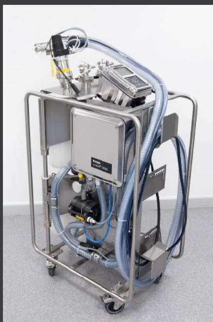
Volle cCare Funktionalität ist auch als mobile Messlösung z.B. für vergleichende Messungen oder temporären Einsatz verfügbar.

sind bei vielen Prozessen und Medien mehrmals am Tag erforderlich, um den Sensordrift minimieren und den gemessenen Werten vertrauen zu können.