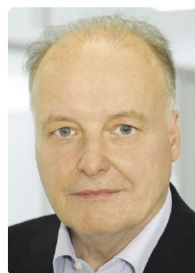
Gunther Kegel, Präsident des ZVEI und Vorstandsvorsitzender der Pepperl + Fuchs Gruppe

vor. Dabei soll mehr als die Hälfte dieser Energie aus heimischen Fotovoltaik- und Windkraftanlagen gewonnen werden. Wenn wir einen deutlich reduzierten Energieverbrauch erreichen wollen, ohne dabei Industrie und Wohlstand zu vernichten, sondern weiter Wachstum generieren, heißt das: Wir müssen lernen, Energie deutlich effizienter einzusetzen und aus dem volatilen Angebot erneuerbarer Energien eine attraktive, wettbewerbsfähige Energieversorgung zu machen. Der Schlüssel zur effizienten Nutzung volatiler, erneuerbarer Energien liegt deshalb in den Sektoren Elektrifizierung, Automatisierung und Digitalisierung.