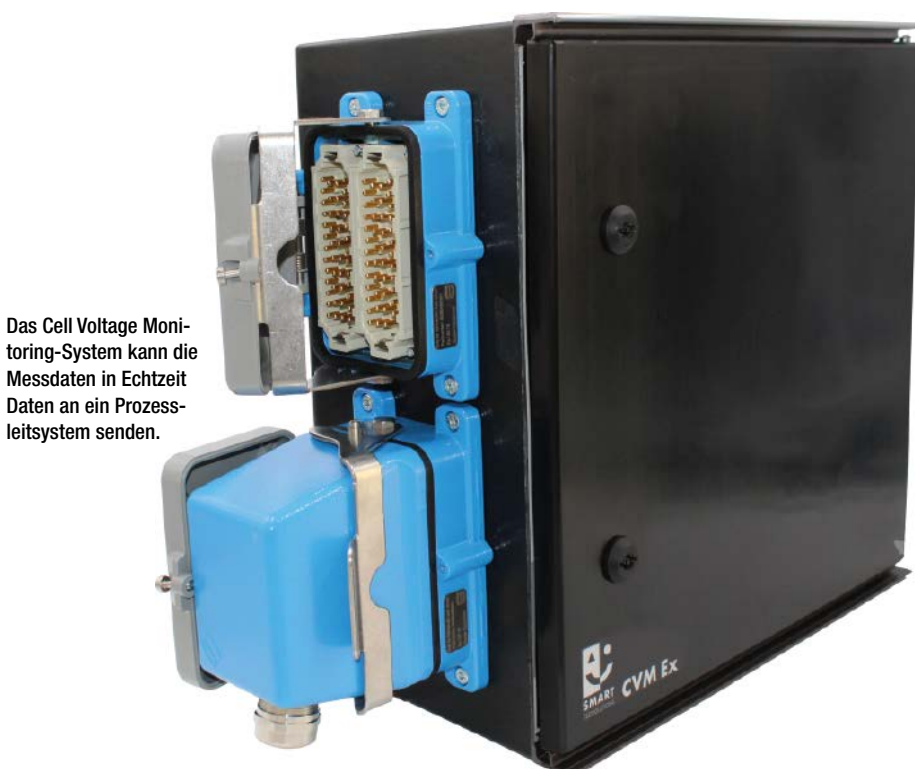
Das Cell Voltage Monitoring-System kann die Messdaten in Echtzeit Daten an ein Prozessleitsystem senden.

Die Herstellung des begehrten Rohstoffs aus Wasser wird durch die Elektrolyse mit Polymermembran-Technologie (PEM) skalierbar und effizient. Mit einer Zellspannungsüberwachung wird der Prozess transparent, einzelne Zellen werden erfasst und liefern in Echtzeit Daten an ein Prozessleitsystem um verlässlich eine Alternative zu den fossilen Energieträgern zu bilden.