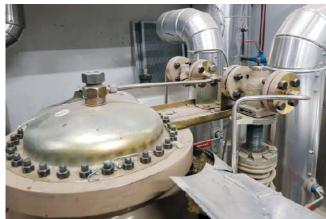
Betriebsdaten – links; Membrangesteuertes Bypass-Ventil (rechts im Vordergrund)