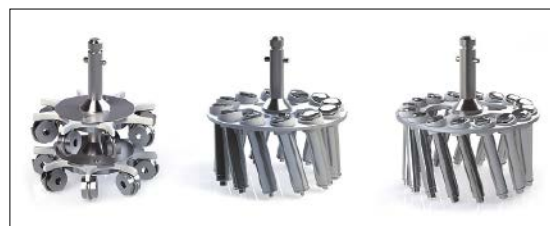
Mit der Poliermaschine von Nortec ist ein Polieren über große Stempelsätze möglich. Aufgrund der speziellen Ausrichtung auf Tablettierwerkzeuge können die Stempel und Matrizen in extra dafür designte Halter eingehängt werden.