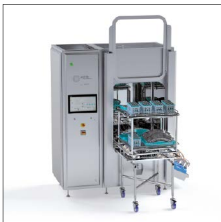
Die Reinigungsanlage von Aruna ermöglicht eine speziell auf Tablettierwerkzeuge abgestimmte, automatische Schwallreinigung.