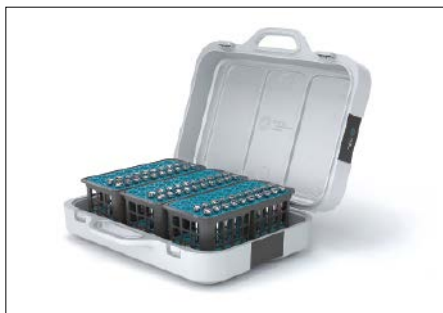
Der Tri.Easy Werkzeugkoffer von Fette Compacting lässt sich für den Transport, die Reinigung und die Lagerung der Tablettierwerkzeuge verwenden (hier mit Stempeln und zugehörigen Trays).