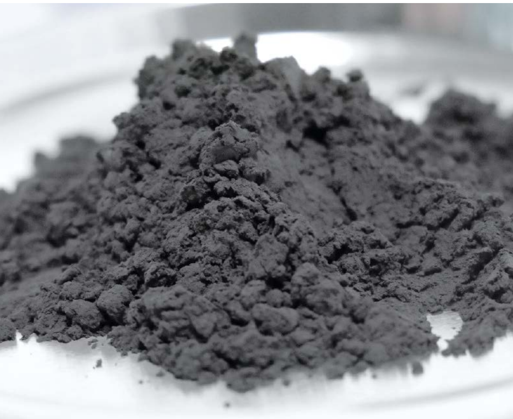
Strukturierte Elektrodenmischung hergestellt im Eirich-Mischer.

nik bekannt, jedoch sehr groß. Zudem sind der sichere Austrag und das Materialhandling der entstehenden elastisch plastischen Massen eine große Herausforderung. Als effiziente Alternative bieten sich Eirich-Mischer an. Für die Herstellung strukturierter Elektrodenmischungen können sie mit Werkzeuggeschwindigkeiten von bis zu 45 m/s betrieben werden. Damit unterscheidet sich der Mischprozess von dem bei der Slurry-Herstellung im MixSolver. Hier dient die kurze Trockenmischphase bei moderaten Werkzeuggeschwindigkeiten lediglich dem Homogenisieren des pulverförmigen Binders und dem Desagglomerieren der groben Leitrußagglomerate. Die eigentliche Dispergierung und Einstellung der Elektrodeneigenschaften geschieht durch Hard Kneading in der plastischen Phase. Doch zurück zur Tro-