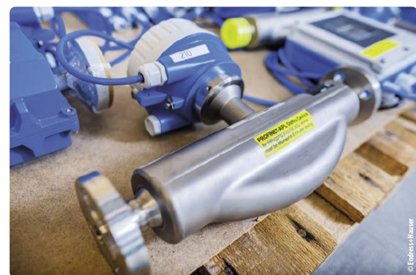
In den Ethernet-APL Lasttest waren fast 240 Messgeräte von Endress+Hauser integriert, darunter Durchfluss-, Druck-, Temperatur- und Füllstandssensoren.