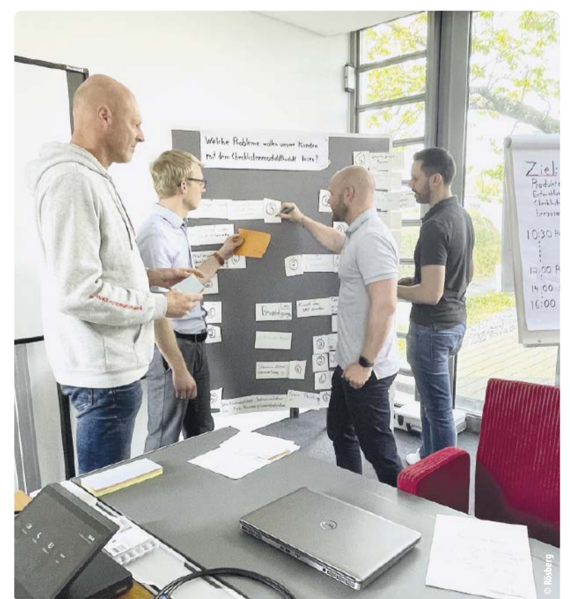
In der Innovationswerkstatt rLab erforschen und diskutieren Rösberg-Mitarbeiter aus allen Fachgebieten neue Markttrends, visionäre Technologien sowie Softwaretools, um daraus neue Produkte zu entwickeln.