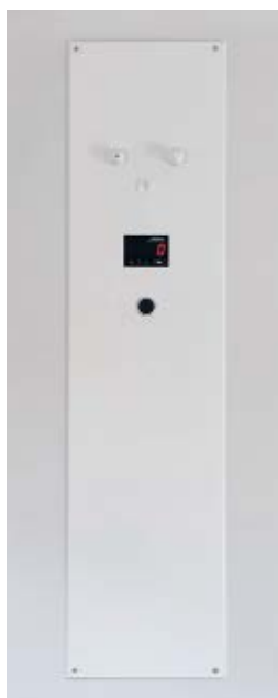
Abb. 3: Briem Messtechnik

Mikroclean GmbH, Grafenberg Tel.: +49 7123/ 374 100-0 info@mikroclean.com www.mikroclean.com