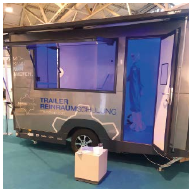
Abb. 4: Trailer auf der Cleanzone