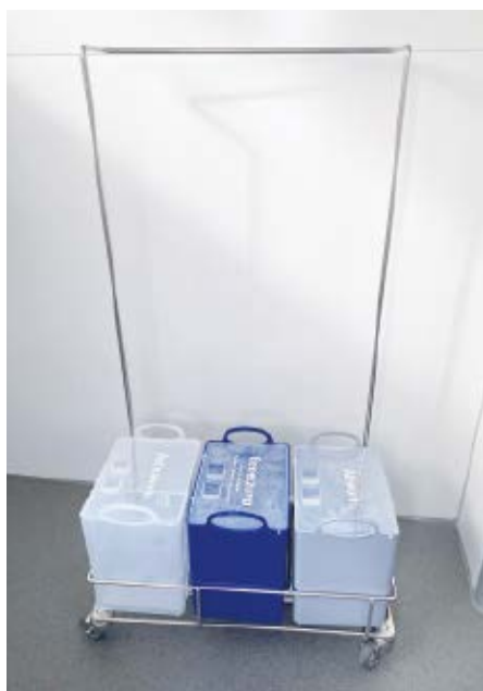
Abb. 2: Pfennig Mini Reinigungswagen

Zu einer effektiven Kontaminationskontrolle in Reinräumen gehört eine regelmäßige Reinigung und Desinfektion der Oberflächen. Wie bei allen Tätigkeiten im Reinraum gibt es hier einiges zu beachten, weshalb Mitarbeiter vor Ausführung dieser Prozesse ausreichend geschult werden sollten. Dank des neuen Trailers gibt es nun eine mobile Möglichkeit, um diese Personalschulungen effektiv umzusetzen. Damit die Reinigung und Desinfektion auch auf kleinem Raum praxisnah geschult werden kann, hat Pfennig einen individuellen Wagen angefertigt (siehe Abb. 2). Dieser soll den Schulungsteilnehmern die Möglichkeit bieten, mit optimal getränkten Wischbezügen und/oder Tüchern verschiedene Oberflächenarten im Schulungsreinraum zu reinigen. Auf diese Weise bekommen die Teilnehmer ein Gefühl für die korrekte Benetzung von Oberflächen und erlernen den Umgang mit Reinigungsequipment im Reinraum.