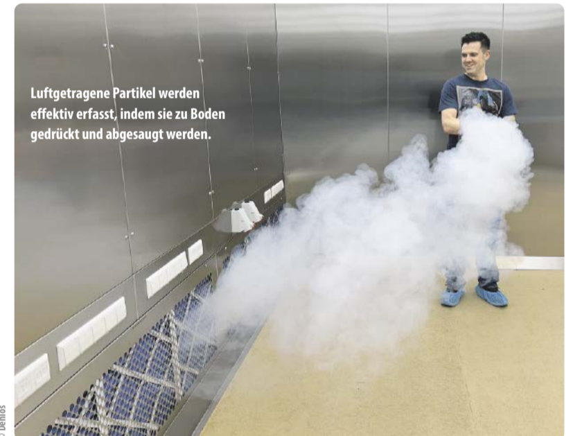
Luftgetragene Partikel werden effektiv erfasst, indem sie zu Boden gedrückt und abgesaugt werden.

ist in Abhängigkeit der einzuhaltenen OEL-Werte zu bestimmen. Dazu werden sechs Intervallabstufungen von OEL-Grenzwerten sog. Occupational Exposure Band (OEB) Klassen zugeordnet. Die Klassifizierung ist mit unterschiedlichen Anforde-