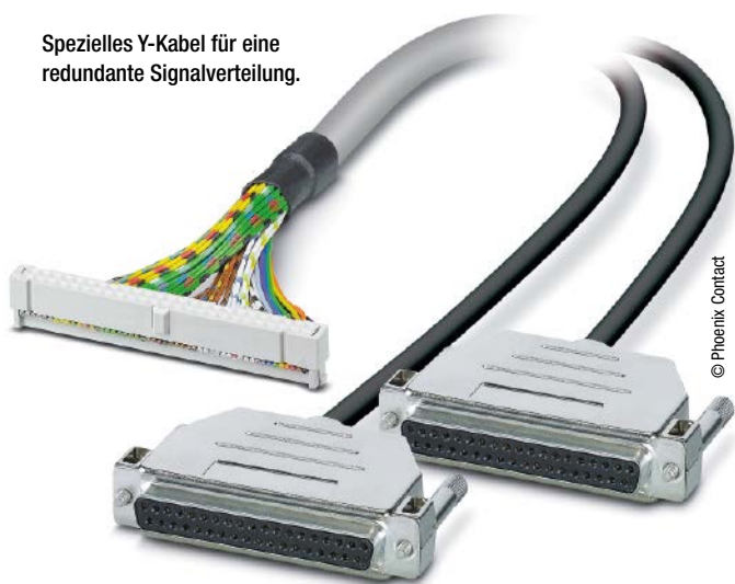
Spezielles Y-Kabel für eine redundante Signalverteilung.

Natürlich kann es sich bei einer individuellen Lösung ebenfalls um die komplette Neuentwicklung eines Artikels handeln. Bei der I/O-Ankopplung an die Steuerung oder der Anbindung der Feld- und Rangierebene an die Steuerungsebene betrifft dies oftmals eine Platinen-basierende Lösung. Eine Neuentwicklung stellt eine Option dar, die im Ein-