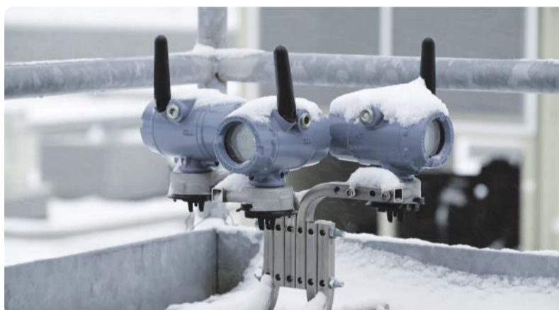
WirelessHart-Gasmonitore wie der Rosemount 928 können schnell und ohne Verkabelungsaufwand in der Anlage hinzugefügt werden.