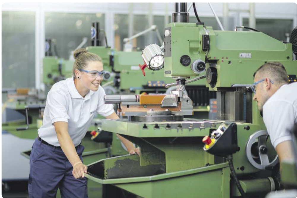
In mehr als 40 verschiedenen Ausbildungsberufen werden aktuell mehr als 1.500 junge Männer und Frauen bei Provalidis für das Berufsleben vorbereitet. So stehen den Unternehmen im Industriepark Höchst hochqualifizierte Fachkräfte zur Verfügung.

Provalidis ist bei der Rekrutierung von Auszubildenden für die Kunden seit vielen Jahren sehr aktiv, mit zahlreichen Veranstaltungen für Jugendliche und Eltern, Schul-Kooperationen, Schnupper-Vorlesungen und vielem mehr. Bei den Aus- und Weiterbildungsspezialisten gehen jährlich immer noch 5.000 bis 6.000 Bewerbungen ein, so dass die rund 450 pro Jahr verfügbaren Ausbildungsplätze gut besetzt werden können. Damit das auch so bleibt, entwickelt Provalidis immer neue Angebote, wie bspw. die „Code Days“, mit denen speziell IT-affine Jugendliche angesprochen werden. Denn Jugendliche müssen sehr zielgruppengerecht angesprochen werden, damit der Bedarf in den unterschiedlichen Ausbildungsbereichen abgedeckt werden kann.