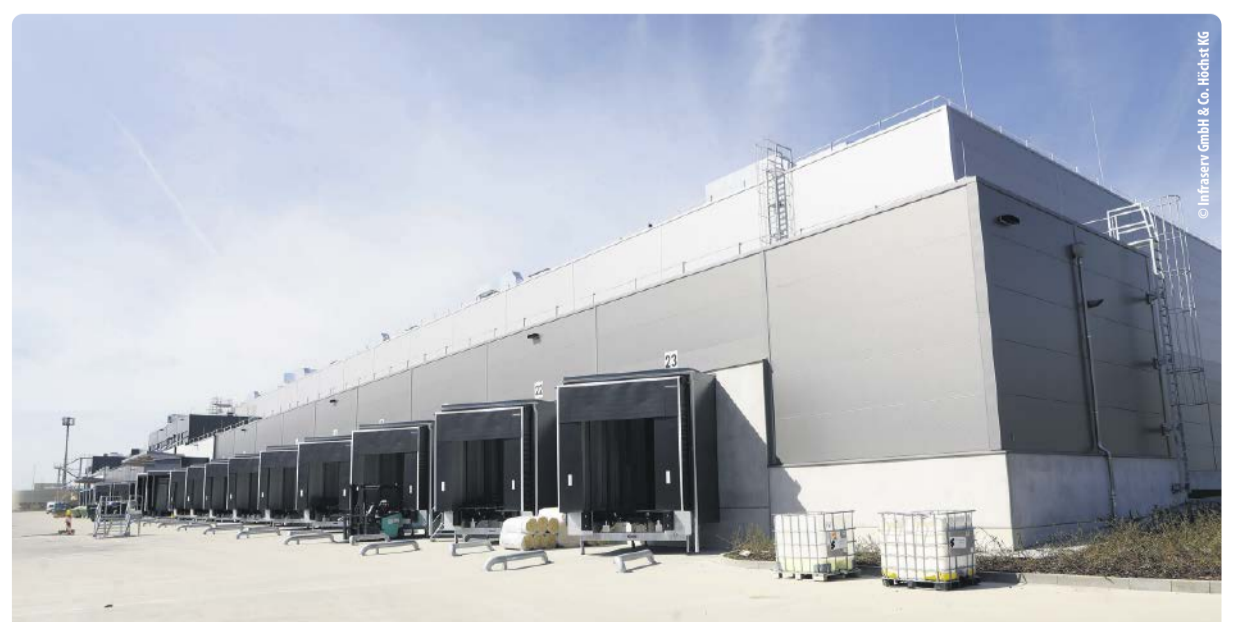
Das neue Gefahrstofflager im Industriepark Höchst setzt Maßstäbe in Bezug auf Sicherheit und Effizienz.