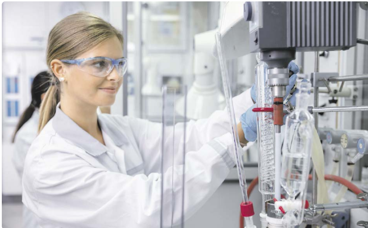
Die Infraseriv-Tochtergesellschaft Provalidis bildet Nachwuchskräfte für viele Kunden aus.

In den letzten Jahren hat die Coronapandemie die ohnehin schon schwierige Situation auf dem Ausbildungsmarkt in mehrfacher Hinsicht verschärft: Unternehmen waren bei der Bereitstellung von Ausbildungsplätzen zurückhaltender, Schüler konnten unter Pandemiebedingungen kaum Informations- und Orientierungsangebote wahrnehmen, und bei den bestehenden Niveaus der Ausbildung zwangsläufig gelitten – in Lockdown-Phasen konnten Nachwuchskräfte nicht wie gewohnt den betrieblichen