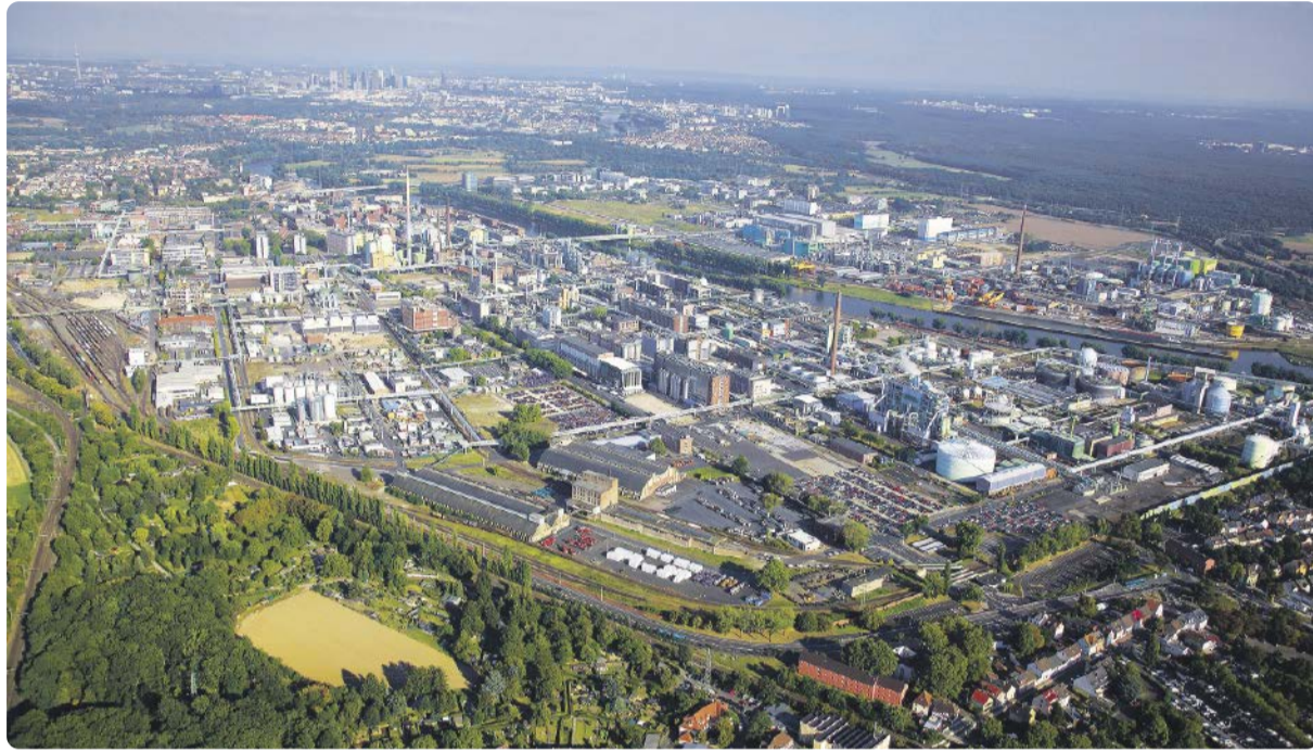
Vor 25 Jahren ist Infraser Höchst als Betreiber-gesellschaft des Industrieparks Höchst gestartet.

Kurze Wege sind auch ein wichtiges Stichwort für international agierende Unternehmen: Die Nähe zum Frankfurter Flughafen, zehn