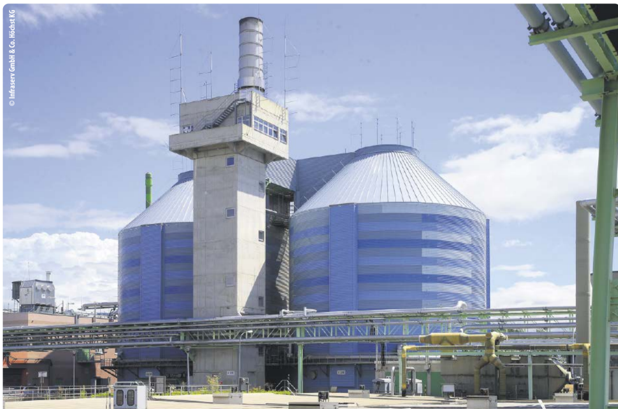
Infraseriv Höchst betreibt eine der größten Biogasanlagen Deutschlands.

chert. Die Triebfahrzeuge sind so leise wie Elektrotriebfahrzeuge und lokal emissionsfrei, weil sie lediglich Wasserdampf und Wärme an die Umwelt abgeben. Allein diese vielen Investitionsmaßnahmen von Infraseriv Höchst, die derzeit alle parallel realisiert werden, sind ein deutlicher Beleg für die dynamische Entwicklung des Industrieparks. Daneben sorgen auch die Standortgesellschaften mit ihren Investitionsprojekten dafür, dass der Standort weiter boomt – beste Zukunftsaussichten also auch für die Standortbetreibergesellschaft Infraseriv Höchst.