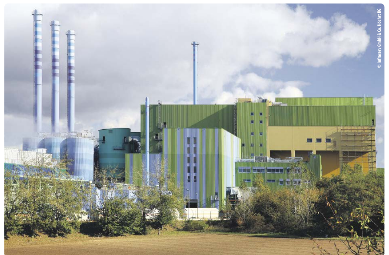
In der Ersatzbrennstoffanlage im Industriepark Höchst, einer der größten Anlagen dieser Art in Deutschland, werden heizwertreiche Abfallfraktionen thermisch verwertet.