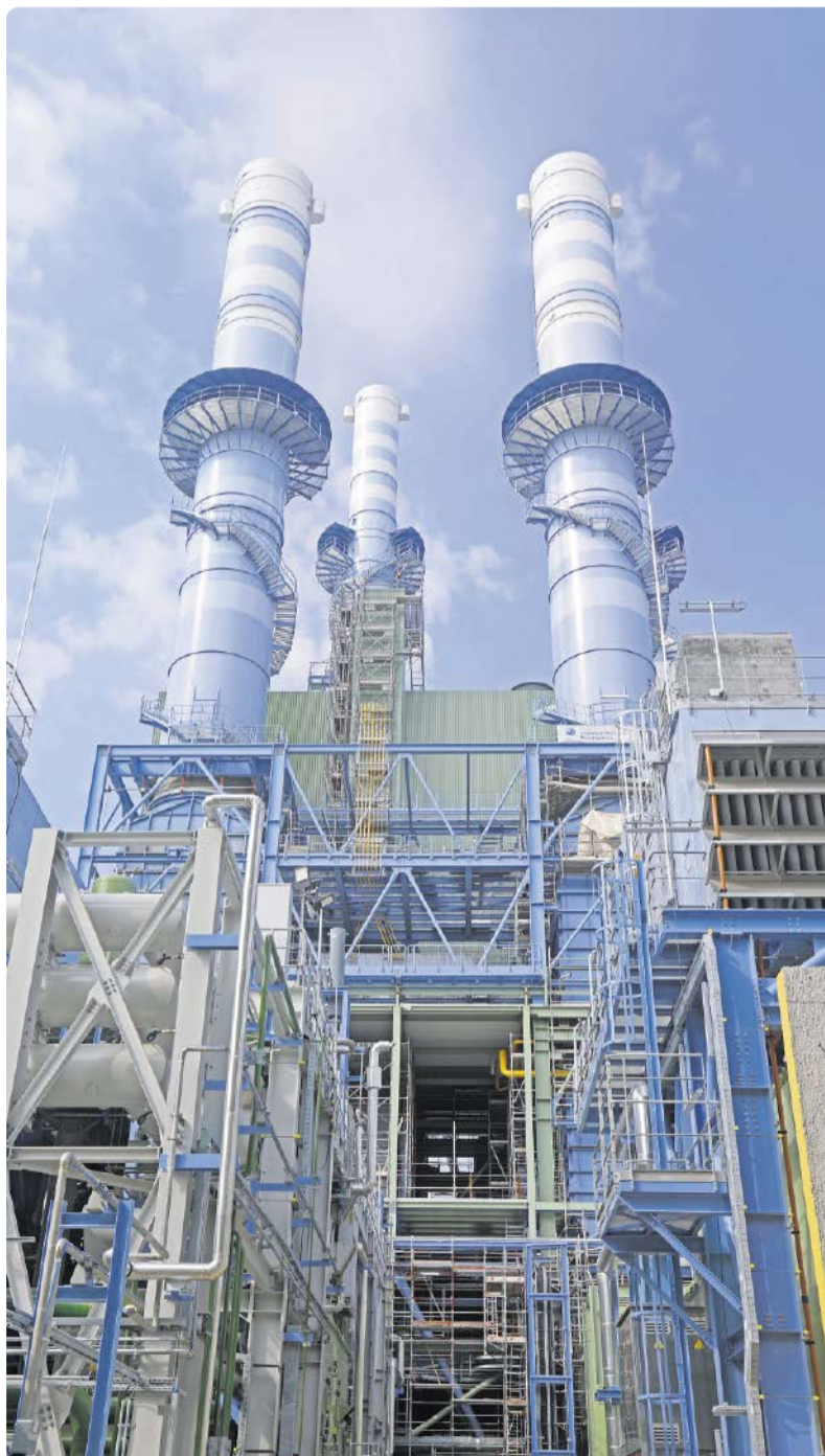
Infraser Höchst investiert einen dreistelligen Millionenbetrag in Gasturbinenanlagen.

Infraser Höchst hat in den vergangenen 15 Jahren bereits verschiedene signifikante Investitionen getätigt, um die Energieversorgungs-Infrastruktur des Standortes zukunftsorientiert und nachhaltig weiterzuentwickeln. So ist der Industriepark Höchst Standort einer der größten Ersatzbrennstoff-Verbrennungsanlagen Deutschlands, in der anstelle fossiler Brennstoffe heizwertreiche Bestandteile von Siedlungs- und Gewerbeabfällen für die Energieerzeugung genutzt werden. Auch die Biogasanlage von Infraser Höchst, die größte ihrer Art in der Bundesrepublik, liefert durch die Umwandlung von Klärschlämmen und organischen Abfäl-