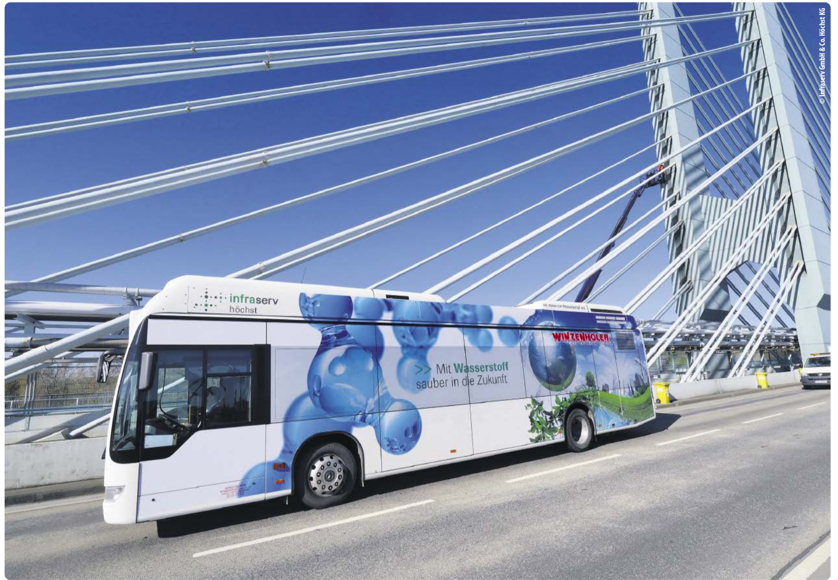
Infraserv Höchst engagiert sich für die Weiterentwicklung der Wasserstofftechnologie. Im Industriepark Höchst sind auch Wasserstoff-Busse unterwegs.

Seit 2007 werden in einer der größten Biogasanlagen Deutschlands in einem eigens entwickelten Verfahren erstmals industrielle Klärschlämme zusammen mit organischen Abfällen in Biogas umgewandelt. Anders als bei vielen anderen Biogasanlagen werden im Industriepark Höchst keine landwirtschaftlichen Nahrungsmittel eingesetzt. Die beiden 30 m hohen Fermenter haben ein Volumen von jeweils 11.000 m 3 . Täglich produziert die Anlage 30.000 m 3 Biogas. Dieses Biogas wird seit 2011 in der Bioerdgas-Aufbereitungsanlage auf Erdgasqualität aufbereitet und