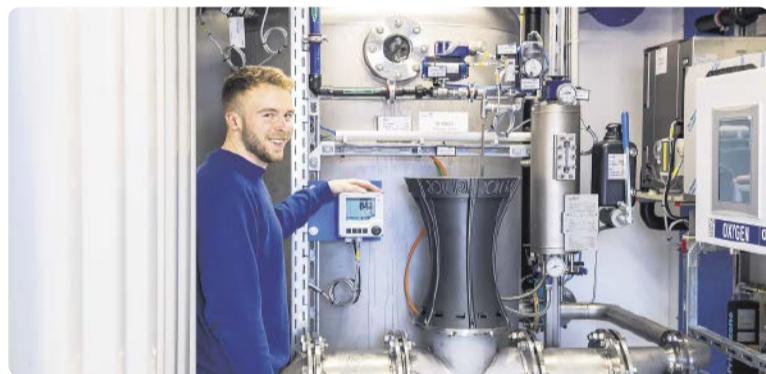
Abwasseroxidation mittels Ozon zur sicheren Entfernung von Medikamentenspuren aus dem Abwasser

EnviroChemie entwickelt für pharmazeutische Unternehmen nachhaltige und effiziente Lösungen zur Abwasserbehandlung. Die Verfahren lassen sich flexibel anpassen, wenn sich Abwasserbestandteile ändern und haben einen möglichst geringen CO 2 -Footprint.