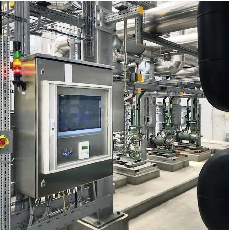
Abb. 2: In der neuen Anlage werden unter anderem auch zwei Non-Seal Spaltrohrmotorpumpen von Lewa eingesetzt. Ein Aggregat fungiert als Primärpumpe für die Zwangsdurchströmung des neu gelieferten Wärmeträgererhitzers.

werden von mehreren dezentralen, sicheren und nicht-sicheren SPS-Steuerungen übernommen. Eine weitere Besonderheit der Anlage ist auch die hohe Vorlauftemperatur von maximal 400 °C, die der möglichen Anwendungstemperatur des eingesetzten Wärmeträgers entspricht. Da auch ein möglichst hoher Anlagenwirkungsgrad gefordert war, kam unter anderem ein Verbrennungsluftvorwärmer zum Einsatz. Dieser senkt durch direkte Wärmerückgewinnung aus den Rauchgasen nicht nur deren Temperatur