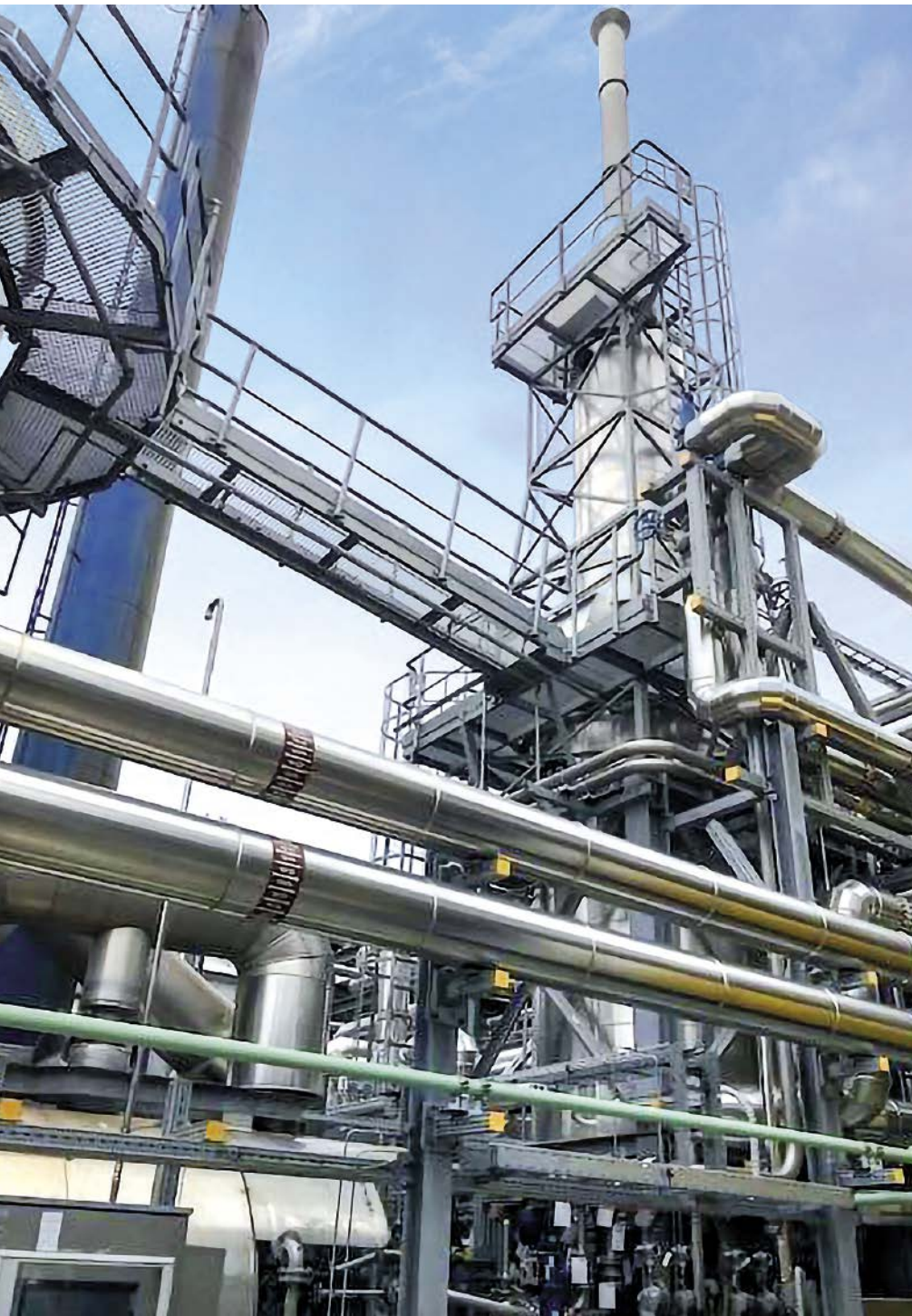
Abb. 1: Da die Leistung der im Jahr 2007 in einer Raffinerie installierten Wärmeträgerölanlage der Classen Apparatebau Wiesloch (CAW) nicht mehr ausreichte, wurde das Unternehmen beauftragt, eine zweite Anlage zu installieren und beide in ein gemeinsames Gesamthydrauliksystem mit allen Hochtemperatur-Verbrauchern und einem gemeinsamen Ausdehnungssystem zu integrieren.

Spezielle Spaltrohrmotorpumpe mit externer Kühlflüssigkeit fördert betriebssicher Thermoöl mit bis zu 400 °C