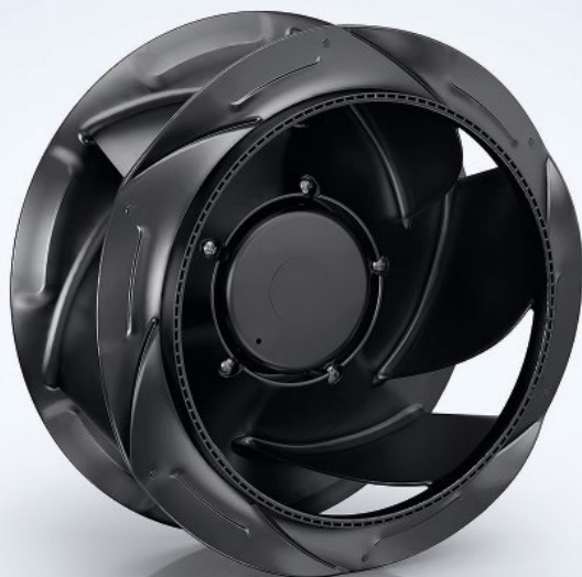
Abb. 3: Die Ventilatoren der RadiCal-Baureihe eignen sich besonders für den Einsatz in Filter-Fan-Units.