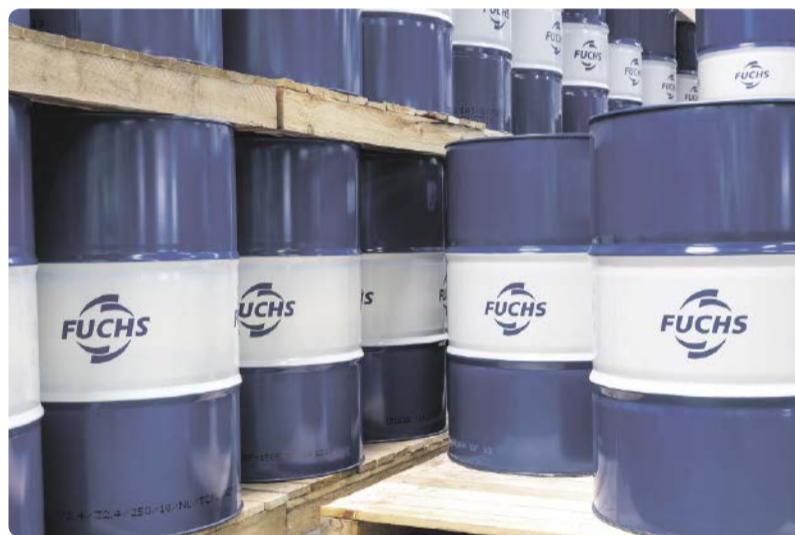
Das zentrale Umschlaglager von Fuchs war ursprünglich auf 450 t Tagesausstoß ausgelegt. Heute liefert der Schmierstoffhersteller in der Spitze 700 t täglich.