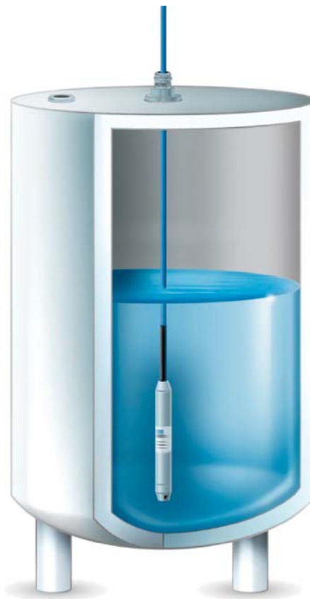
Abb. 3: Schematische Darstellung der Füllstandmessung mit einer Pegelsonde im belüfteten Tank

Im Vergleich zur Langzeitstabilität spielt die Genauigkeit bei den meisten Applikationen in der Regel eine eher sekundäre Rolle. Ein Wert von 0,5 % ist Standard und reicht in diesen Fällen aus. Ausnahmen bilden bspw. Messaufgaben im Bereich Food & Pharma, wo die Unternehmen aus Gründen der Prozesssicherheit oder wegen des wirtschaftlichen Werts der jeweiligen Medien nach Genauigkeiten von bis zu 0,1 % verlangen.