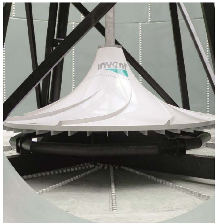
Abb. 1: Das mechanische Hyperclassic-Rühr- und Begasungssystem wird seit über 20 Jahren in industriellen Abwässern eingesetzt