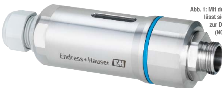
Abb. 1: Mit dem Fieldport SWA50 lässt sich der „zweite Kanal“ zur Datenübertragung (NOA-Konzept) auch in Brownfield-Anlagen problemlos nachrüsten.

Die NAMUR Open Architecture (NOA) ist eine wichtige Brückentechnologie von den streng hierarchischen Strukturen der Industrie 3.0 zur voll-netzten, digitalen Industrie 4.0. Die parallele Datenübertragung als Erweiterung macht sie ideal für Bestandsanlagen. Heute werden 97% der Daten aus Feldgeräten nicht genutzt. Das ist ein riesiges Datenpotential in bestehenden Anlagen, das durch die Digitalisierung erschlossen werden könnte. Diese bietet dem Anwender Chancen auf ein permanentes Asset-Monitoring. Geräte können eindeutig identifiziert, Einstellparameter und die korrekte Auslegung am „digitalen Zwilling“ gespiegelt werden. Im laufenden Betrieb lässt sich der Gesundheitszustand „smarter Sensoren“ dank moderner Diagnosefunktionen permanent überwachen.