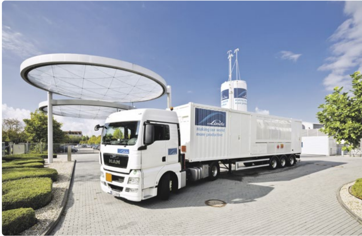
Trailer zum Transport von kryo-komprimiertem Wasserstoff für mobile H 2 -Betankungen vor dem Linde Hydrogen Center in Unterschleißheim bei München.

Hinzu kommen noch Anwendungen im Energiebereich. Bei Power-to-X-Technologien kann Wasserstoff vorteilhaft als Pufferspeicher zur Unterstützung erneuerbarer Energiequellen eingesetzt werden. Strom aus Wind- und Solarenergie ist damit sehr flexibel einsetzbar und kann dann zur Verfügung ge-