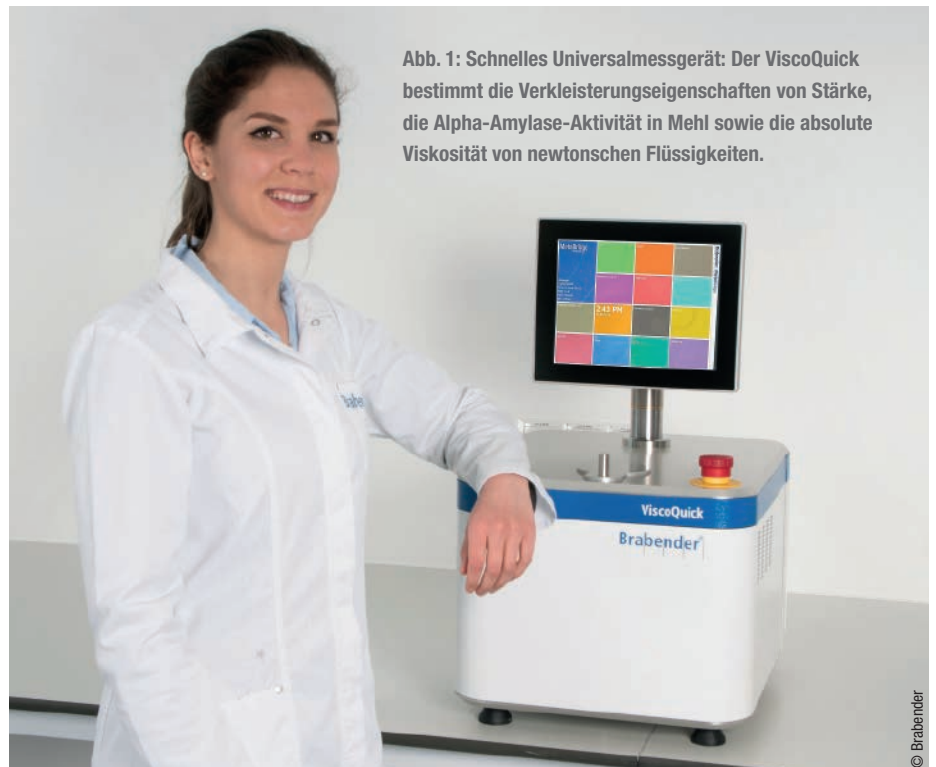
Abb. 1: Schnelles Universalmessgerät: Der ViscoQuick bestimmt die Verkleisterungseigenschaften von Stärke, die Alpha-Amylase-Aktivität in Mehl sowie die absolute Viskosität von newtonschen Flüssigkeiten.

Gemessen werden kann das Viskositätsverhalten von ganz unterschiedlichen pastösen und viskosen Materialien in Abhängigkeit von der Temperatur sowie die Verkleisterungseigenschaften von Stärke und anderen Materialien. Eine leistungsfähige Heiz-/Kühlfunktion