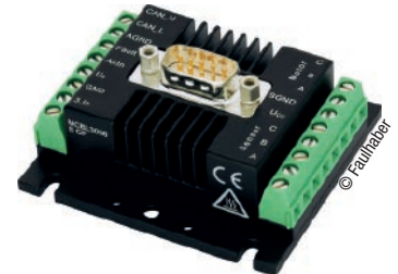
Abb. 5: Der Controller ist perfekt auf den Motor abgestimmt und benötigt wenig Einbauplatz.

zum Sensor, denn das Drehmoment erlaubt den Rückschluss auf die Viskosität. Die Drehzahl-Drehmoment-Kennlinie des Motors muss deshalb für den Einsatz im ViscoQuick möglichst linear sein, vor allem im niedrigen Drehzahlbereich. Je nach Analyseaufgabe liegen die Drehzahlen zwischen 0 und 500 Umdrehungen pro Minute.