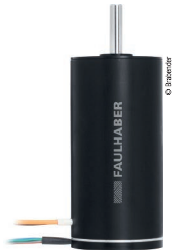
Abb. 2: Der wiederverwendbare Messtopf aus Edelstahl auch für Säuren und Laugen.