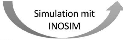
Daten in INOSIM-Excel Schnittstelle